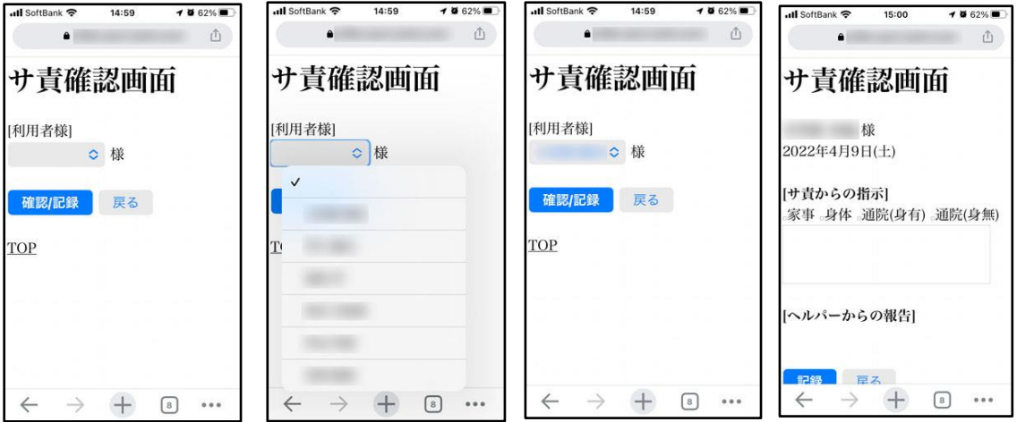
[利用者様を選択] [確認/記録をタップ] [提供種類と指示を記入し記録をタップ]