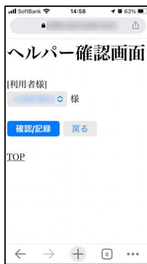
[確認/記録をタップ]