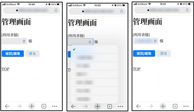
[利用者様を選択] [確認/記録をタップ]