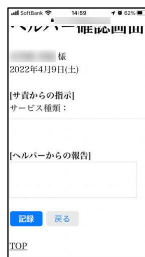
[提供前：サ責の指示の確認]