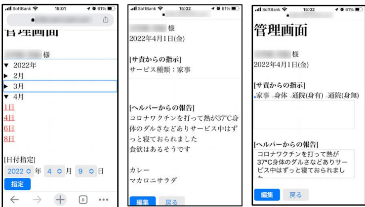
[内容確認画面] [内容編集画面]