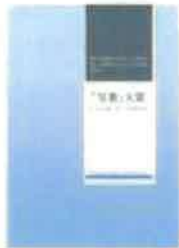
「写書」大賞作品集表紙